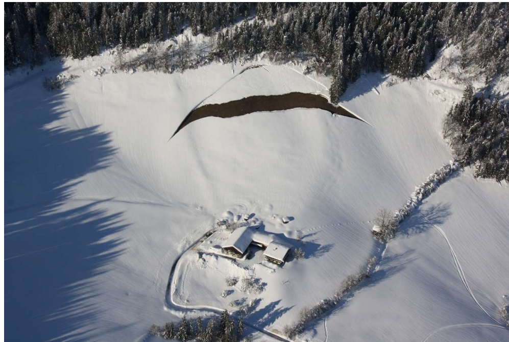
Gleitschneemaule oberhalb eines Gehöfts in Moderegg (Werfen) im Jahr 2019