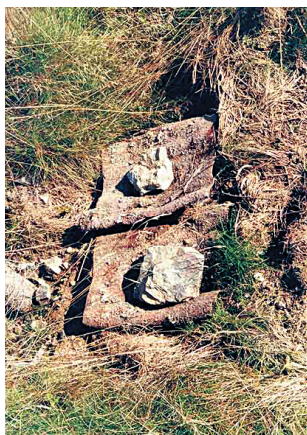
Fangrinden werden gefaltet und fixiert auf die Bekämpfungsfläche gelegt.

Beim Auslegen der Fangrinde wird zunächst die Bodenvegetation entfernt. Die Fangrinde wird in die dadurch entstehende kleine Mulde gelegt (geringere Austrocknung, Rüsselkäfer bewegen sich eher am Boden als im Gras) und mit einem Stein beschwert. Die Markierung der Auslegestelle mit einem Pflock ist zum Wiederfinden der Rinde im hohen Gras nötig. Die Fangrindenkontrolle sollte wöchentlich am besten in den Morgenstunden erfolgen, da bei kühlen Temperaturen die Käfer sehr langsam sind und daher leicht gesammelt werden können. Die gesammelten Käfer werden bekämpfungstechnisch behandelt. Die Begiftung der Fangrinden ist möglich.